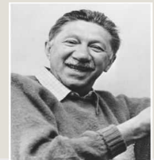
La piramide dei bisogni di Maslow (1954)